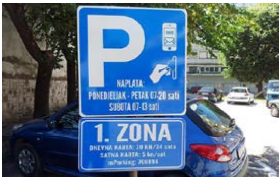
克罗地亚常用的停车牌

合法停车地点一般会树立带有白色“P”字母的停车标志(如下图)。在露天停车点，非周末期间，一般从早上7:00-22:00点需要付费，付费标准根据停车地点不同而不同，周六付费时间段一般是7:00-15:00。具体收费时间段及收费标准需注意停车牌或收费机器上的规定。周日免费。