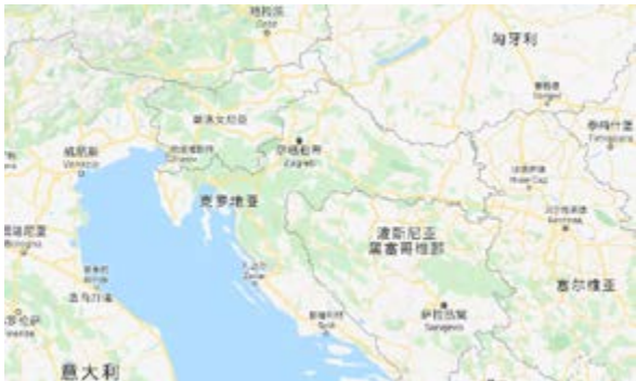
克罗地亚地理位置图

位于欧洲中南部，巴尔干半岛西北部。西北和北部分别与斯洛文尼亚和匈牙利接壤，东部和东南部与塞尔维亚、波斯尼亚和黑塞哥维那、黑山为邻，南濒亚得里亚海，与意大利隔海相望，岛屿众多，海岸线曲折，长1880公里。